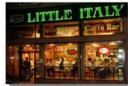
Glasgow, Byres Road

Il cammino verso l'integrazione è riuscito, ma solo col tempo e superando molte difficoltà.