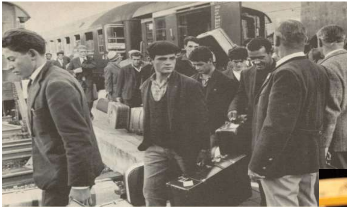
CHI PARTE E CHI RESTA. Ancora una volta si ripete il dramma dell'emigrazione meridionale: alla stazione di Wolfsburg, in Germania, un treno scarica uomini venuti dal Sud in cerca di un lavoro. Davanti ad aprire un futuro reso più difficile dalla solitudine, dall'incomprensione e spesso dal disprezzo razzista, sfruttano la loro fatica.